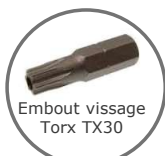
Embout vissage Torx TX30