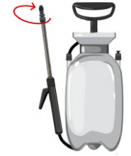
Régler la buse en faisant une rotation