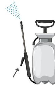
Effectuer le traitement