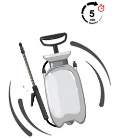
Fermer le pulvérisateur puis remuer