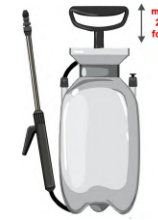
Mettre en pression à l'aide de la pompe