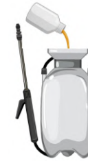
Ajouter le produit