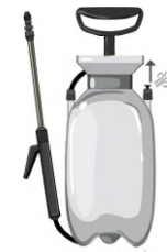
Retirer la pression en tirant la soupape